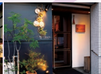
下鴨茶寮 × 洋食おがた