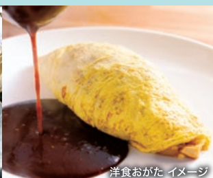
洋食おがた イメージ